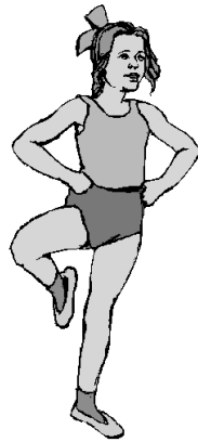
Fitnessstraining für Damen