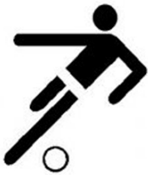
Fitness und Ballspiele für Herren